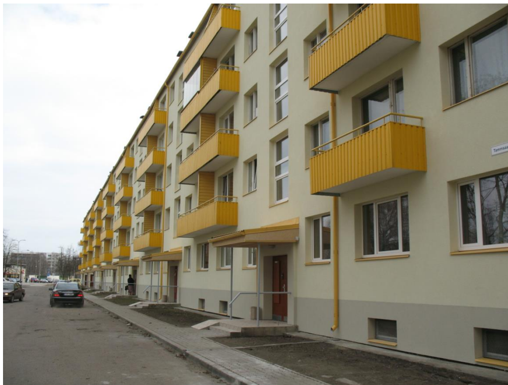
Tammsaare tee 103