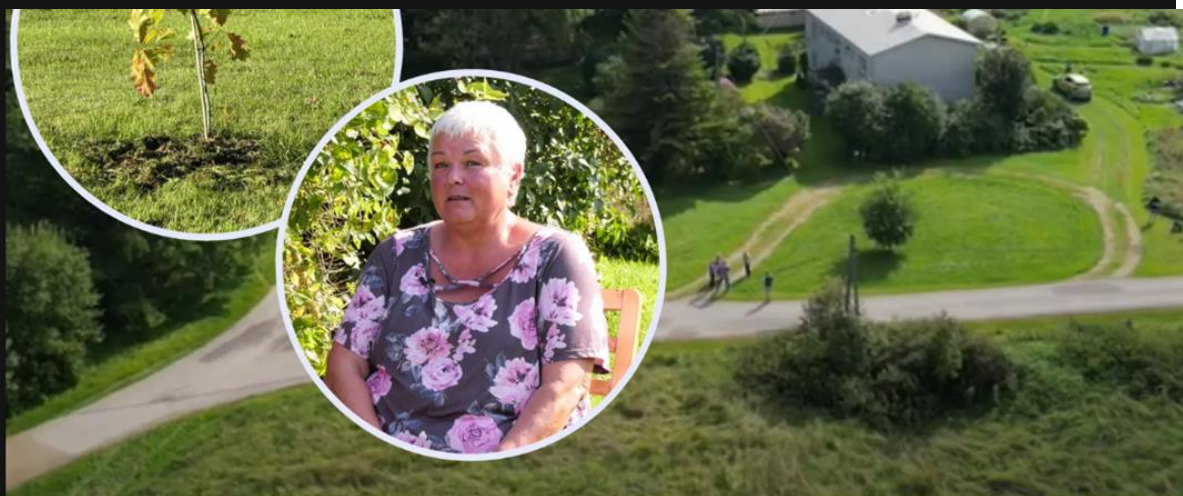
Kose vallas maeti korteriühistu hoovi majaelanike säilmed.

...Kutsusime kokku korteriühistu koosoleku. Saatsime 15.08.2024 kutse kõikidele korteriomanikele. Vahepeal lahkus mu ema, seetõttu korraldati 21.08.24 Kivi KÜ-s erakorraline koosolek. Koosolek toimus ja osales 75% korteriomanikest, kes hääletasid puumatuste poolt ja kinnitasid seda oma allkirjaga